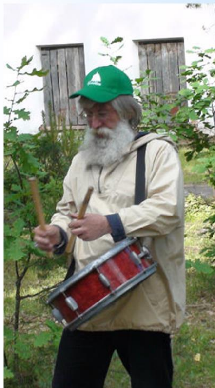
Без слов. И так понятно.