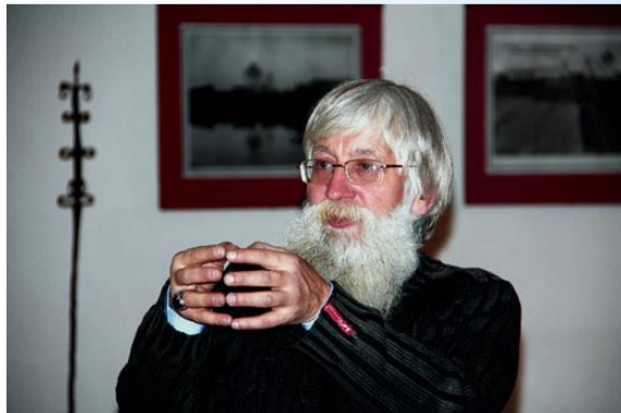
Варакин —не просто Варакин. Варакин-Чародей. Причём, высшего класса!