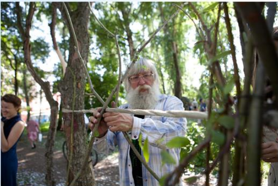
Каждое дело— творчески! А иначе — зачем?