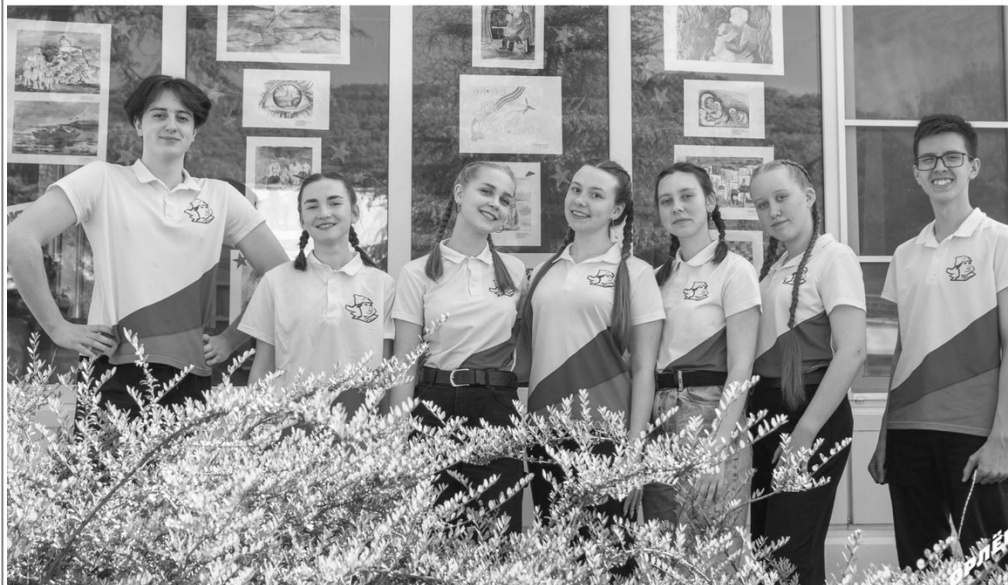
В рамках акции «Окна Победы», организованной Российским движением детей и молодежи «Движение Первых» орлята украсили окна лагерей и образовательных площадок Центра.

Благодаря подобным мероприятиям, орлята осознают значимость сохранения о героизме советских солдат и мирных жителей во времена Великой Отечественной войны. Дух патриотизма теперь сопровождает их повсюду, потому что такие события не проходят бесследно.